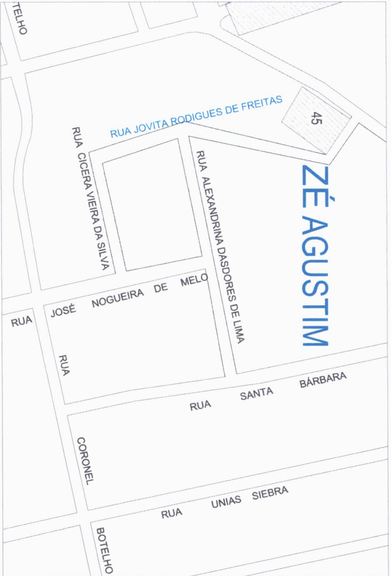
PLANTA DE DENOMINAÇÃO DA RUA JOVITA RODRIGUES DE FREITAS